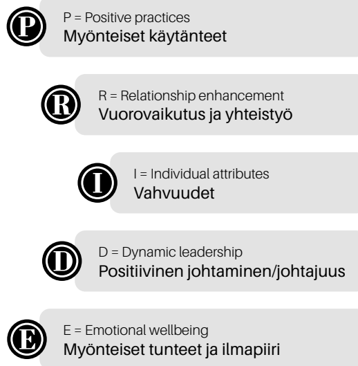
Kuvio 1. Positiivisen organisaation osatekijät PRIDE-teorian mukaan.